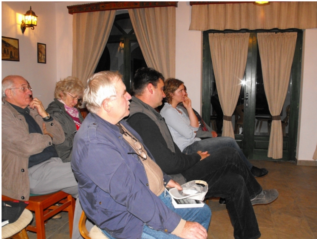
A torockói közönség