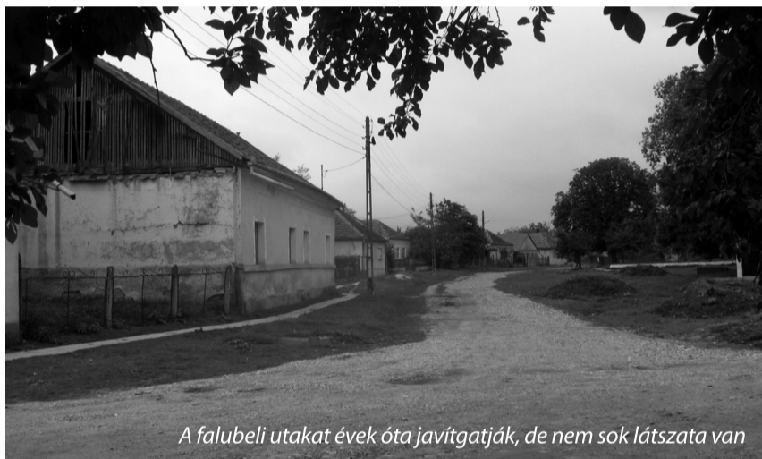
A falubeli utakat évek óta javítgatják, de nem sok látszata van

Ékes példa erre a kiszolgáltatottságra az, hogy az őslakosok legelőit az érkeserői kisistenek – élükön az RMDSZ-es alpolgármesterrel – kb. egy éve elkezdték önkényesen kisajátítani, felszántani. Az idős emberek (sokuk közülük már a nyolcvanas éveit tapossa) nem értenek a jogi csúrcsavarokhoz, többnyire románul is igen rosszul beszélnek, így nincs nehéz dolga annak a pár dörzsölt földfoglalnak, aki elkeríti, felszántja az öregek legelőit. Egy te-repszemle során mintegy tizenöt ilyen esetről értesültünk. A kommunizmus ideje alatt államosított közbirtokossági legelőket a falubeliek nem igényelték vissza. A megválasztott vezetők elmulasztották felvilágosítani az embereket restitúciós jogaikról. A keserői legelők maradtak a falu tulajdonában, az őslakosok belementek abba, hogy nem fizetnek legelő-