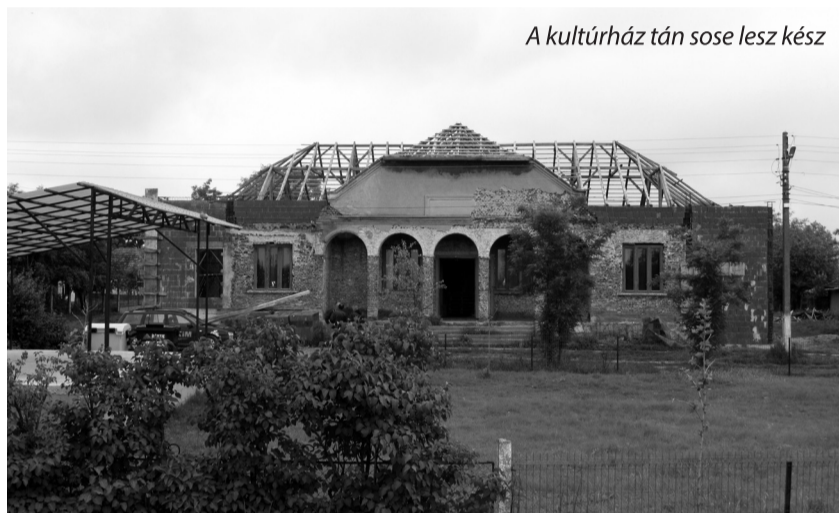
A kultúrház tán sose lesz kész

párt színében indult, jelenleg ő is a tulipán jegy alatt uralkodik a faluban.