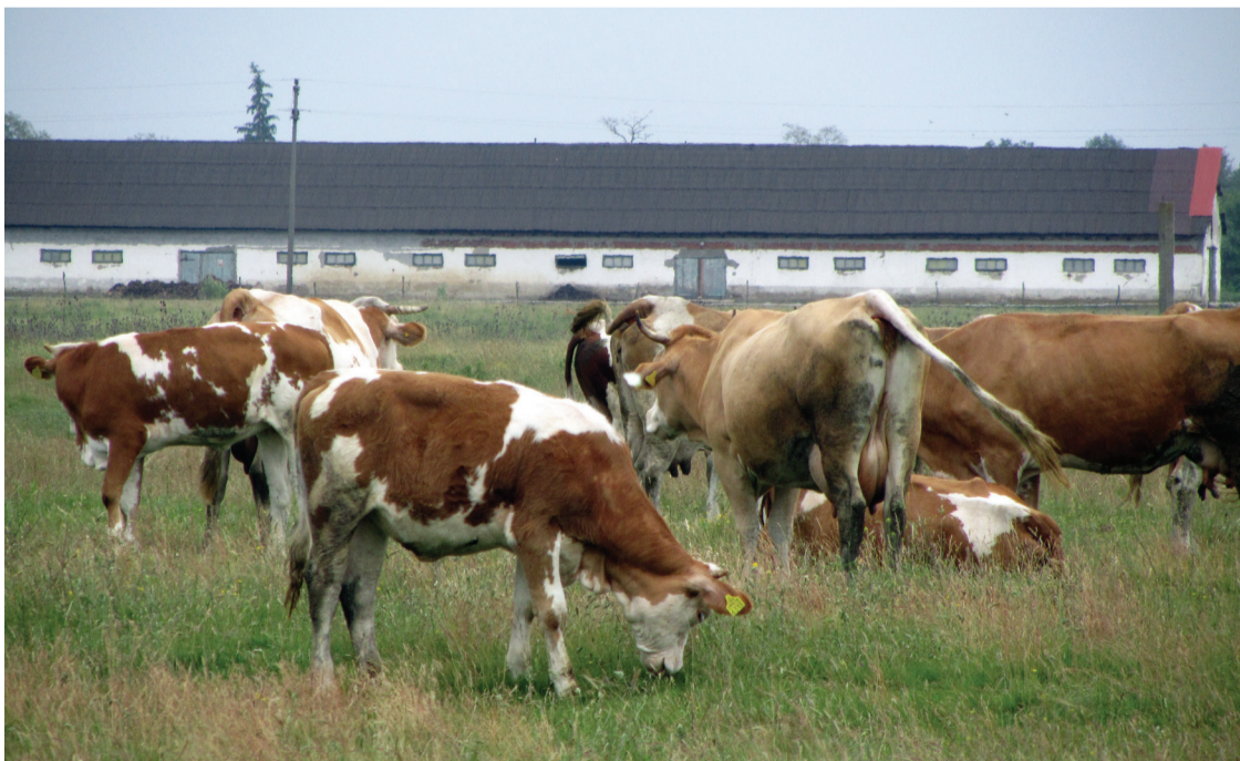
Ma még van hol legeljenek a keserűi gazdák tehenei, de a földrablók egyre nagyobb részeket oroznak el a legelőkből

fejlődés mutatkozzon. Terepszemlénk során azt tapasztaltuk, az emberekben itt egy sajátos – amúgy szinte az egész Partiumban és Erdélyben jellemző – viszonyulás alakult ki: az RMDSZ-be már, a Néppártban még nem bíznak (a Magyar Polgári Pártról meg nem is igen hallottak). Nehéz szóra bírni az embereket itt, a politikai kisistenek maffiamódszerei ugyanis sikeresen kitermelték itt is az úgynevezett suttogó magyart, aki eleinte bízik, majd reménykedik, később csalódik és elhallgat. Nem mer nyilatkozni, nem meri elmondani a gondjait. Szavazni sem megy el aztán a lapító magyar. Miért is menne, hiszen az egyszerű falusi ember ösztönös éleslátásával tudja és világosan látja, hogy a politikai tragikomédiák főszereplői nemcsak nem tisztességesek, hanem gyakran olyan gazemberek, akikre a magyar ember nemhogy nem szavaz, de a pipáját sem bízna rájuk. Az érkeserűi suttogó magyarok végül mégis nyilatkoztak. Megeskették a riportert, hogy titokban tartja a nevüket, ugyanis ki kell mondani: a megfélemlítés az Érmelléknek folytatása a 6. oldalon