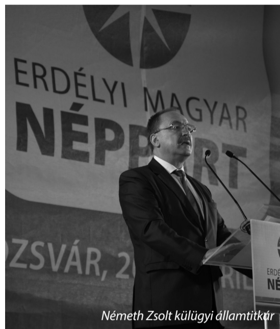
Németh Zsolt külügyi államtitkár

A Küldöttgyűlésen a magyarországi kormánypártok (Fidesz-KDNP) mellett a Jobbik és az LMP is az autonómia-törekvések támogatásáról biztosította a küldötteket, ugyanakkor az ügy mellett a katalán Marc Gafarot, a Katalán Demokratikus Konvergencia külügyi kabinetvezetője, és Francois Alfonsi, Korzika európai parlamenti képviselője, valamint a külföldi magyar pártok és civil szervezetek képviselői is felszólaltak.