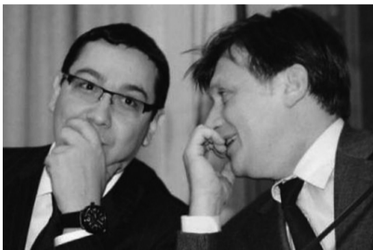
Ponta és Antonescu pártelnökök a felírt kezeléssel egyeztetnek

ve kizuhant ágyából, egyenesen fejre esett s csillagokat látott, melyekben rémulően ismerte fel a Néppárt csillagait. Mesterházy Attila, aki Ponta kispajtása még a pionírtáborból, nagylelkűen felajánlotta kollegájának azt a MSZP-s csodaszert, melyet doktor Gyurcsány Ferenc őszödi laboratóriumában állítottak elő, és Hazudós Fletónicín néven forgalmazznak liberális körökben. A szer hatására a páciens elrugaszodik a valóságtól, megszűnik az igazsággal és a jogállamisággal minden kapcsolata, s nem okoz neki traumát sem a nemzetárulás, sem a hazudozás. A csodaszertől kell szedni reggel, délben, este, mindig és mindenütt a siker érdekében. Ponta megköszönte Mesterházy ajándékát s értesüléseink szerint már el is kezdte a kúrát a Hazudós Fletónicinnel.