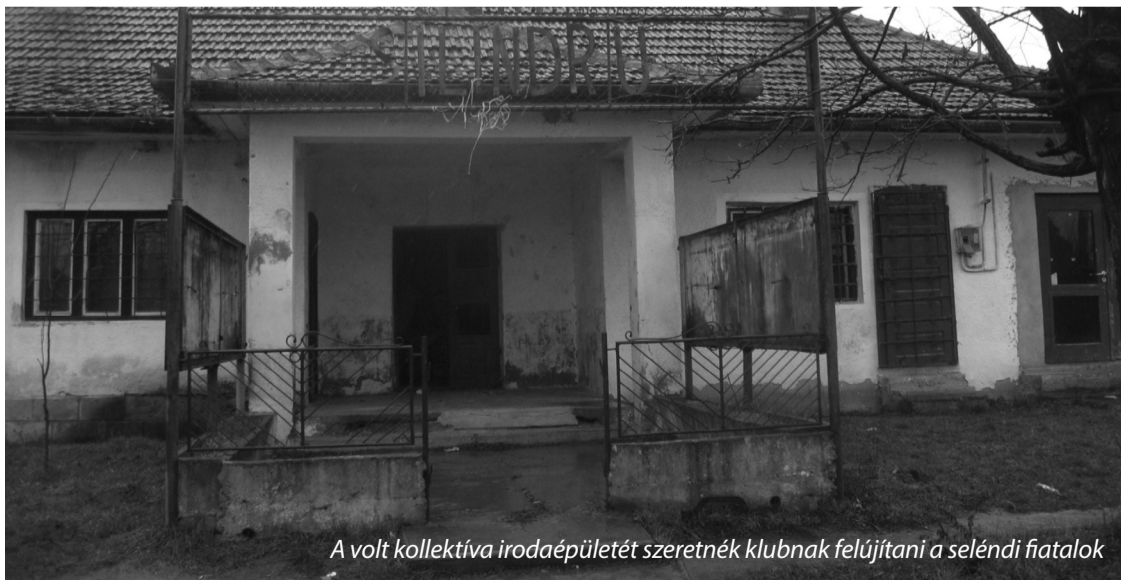
A volt kollektíva irodaépületét szeretnék klubnak felújítani a seléndi fiatalok

Ezt a kérdést megválaszolni egyelőre nem lehet, azonban úgy tűnik, ki kell mondani, le kell írni a cseppet sem biztató igazságot, miszerint akadnak olyan helyek ma a Partiumban, ahol a Ceaușescu féle falurombolást, mint egy kommunizusból átöröklött (átmentett?) átkot éppen azok teljesítik be, hajtják végre, akik (legalábbis a papírforma szerint) arra kötelezték magukat, hogy a magyarság érdekeit, megélhetését és megmaradását fogják itt segíteni.