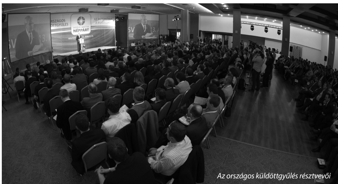
Az országos küldöttgyűlés résztvevői