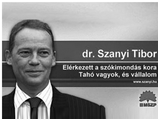
2012-es szocialista plakát az ösztinteség jegyében

* Román nyelvórákat vett Szanyi Tibor Kolozsváron, derült ki egy magát megnevezni nem akaró informátor jóvoltából. Egy, az anonim alkoholista terápiai foglalkozására járó férfi a RémhírPress kérdésére elmondta, az elvonókúrákon és csoportterápiákon csapattársa, Szanyi kapitány, homályosan arra célzott, hogy különböző liberális túlvilági erők hangjainak sugallatára kell leromániznia az erdélyi, partiumi magyarokat. Mivel azonban valójában a tiszta magyar beszéddel sincs napirenden, szeretne megtanulni legalább románul, ugyanis elképzelhető, hogy szocialista pártvezérei a jövőben gyakran küldik Bukarestbe kamatoztatni nyelvtudását.