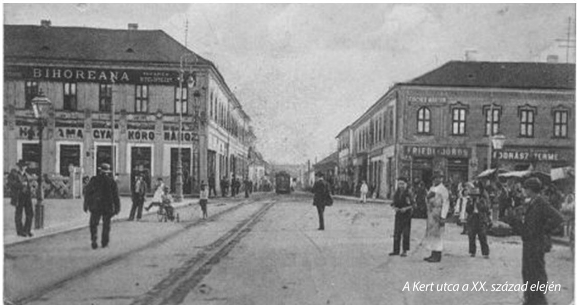
A Kert utca a XX. század elején

Mégis meglepő volt, amit az előzetes településrendezési elképzelésekből egy úgynevezett „mesterterv” formájában Bolojan polgármester közreadott, hiszen igencsak furcsa víziókkal lepte meg a váradiakat. Ezek közül a legnagyobb felháborodást a Kert utca (hivatalosan Avram Iancu) tűzoltóság felőli oldalának teljes lebontása, és a Várház utca (Sucevei) központ felőli oldalának teljes bontási terve okozta. A Kert utcai bontások oka az lenne – a bejelentés szerint –, hogy oda kerékpárutat terveznek, amely jelenleg nem férne el. Persze a kerékpár-úthálózat kiépítése tetszetős és népszerű gondolat, kampányolnak vele immáron közel tíz éve román és magyar politikusok egyaránt, azonban mindezidáig valódi és biztonságos szakasz, melynek haszna is lenne, nem sok, mondhatnánk egy méternyi sem épült. A mestertervből hamar kiderült, hogy a Kert utcára nem a biciklik nem férnek el, hanem az a villamos pálya, melyet a Rulikovszki úton át a körgyűrűig szeretnének vezetni, illetve az a négysávos út melyet oda gondoltak ki a városunktól idegen szakemberek. Csak borzolta