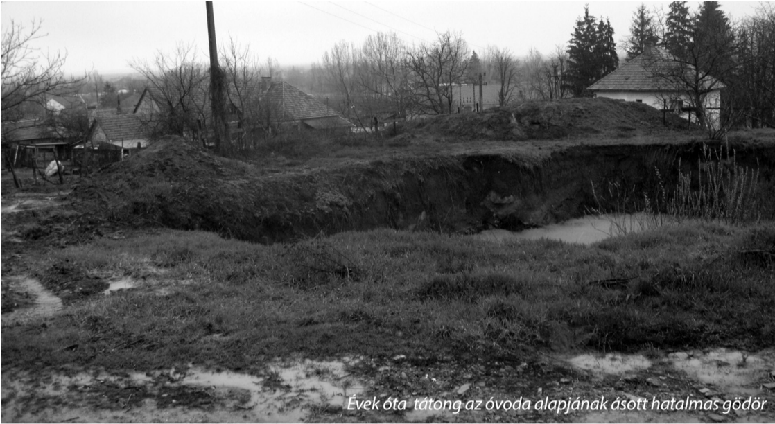
Évek óta tátong az óvoda alapjának ásott hatalmas gödör

Szalacs az Érmellék egyik legnagyobb, zömmel magyarok lakta községe, amely különösen a jó borairól és nyakas lakóiról lett híressé, azonban úgy tűnik, jelenleg valami még sincs rendben az ott élő magyar közösség összetartásával. Nehéz lenne megmondani, hogy az elmúlt évek politikai csatározásai okozta csalódások, vagy az ebből fakadó közöny okozza-e ezt, de tény, hogy egyre inkább azt éreznék: ezen a településen elég sok probléma vár megoldásra. Itt van mindjárt a szebeni csobánok önkényes garázdálkodása a szalacsi közlegelőkön és magántermőföldeken, amiről a megyei sajtó is beszámolt.