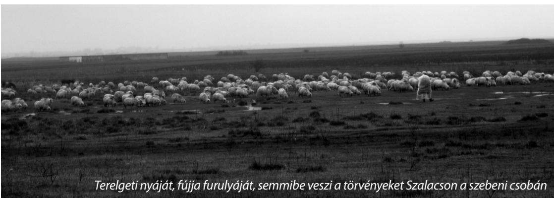
Terelgeti nyáját, fújja furulyáját, semmibe veszi a törvényeket Szalacson a szebeni csobán