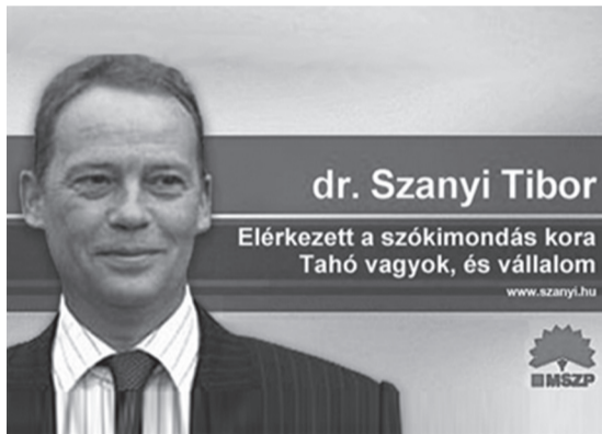
2012-es szocialista plakát az őszinteség jegyében

* Román nyelvórákat vett Szanyi Tibor Kolozsváron, derült ki egy magát megnevezni nem akaró informátor jóvoltából. Egy, az anonim alkoholista terápia foglalkozására járó férfi a RémhírPress kérdésére elmondta, az elvonókúrákon és csoportterápiákon csapattársa, Szanyi kapitány homályosan arra célzott, hogy különböző liberális túlvilági erők hangjainak sugallatára kell lerománózni az erdélyi, partiumi magyarokat. Mivel azonban valójában a tiszta magyar beszéddel sincs napirenden, szeretne megtanulni legalább románul, ugyanis elképzelhető, hogy szocialista pártvezérei a jövőben gyakran küldik Bukarestbe kamatoztatni nyelvtudását.