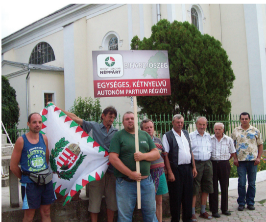
Diószegen lekesen demonstráltak