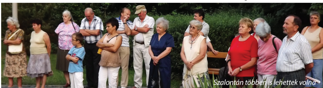
Szalontán többen is lehettek volna

CSILLAGOS HÍREK Kiadja az Erdélyi Magyar Néppárt Bihar megyei szervezete Szerkesztőség címe: 410004 Nagyvárad, Széles (Menumorut) utca 23. tel.: 0040-762-248-691 e-mail: neppart.bihar@gmail.com