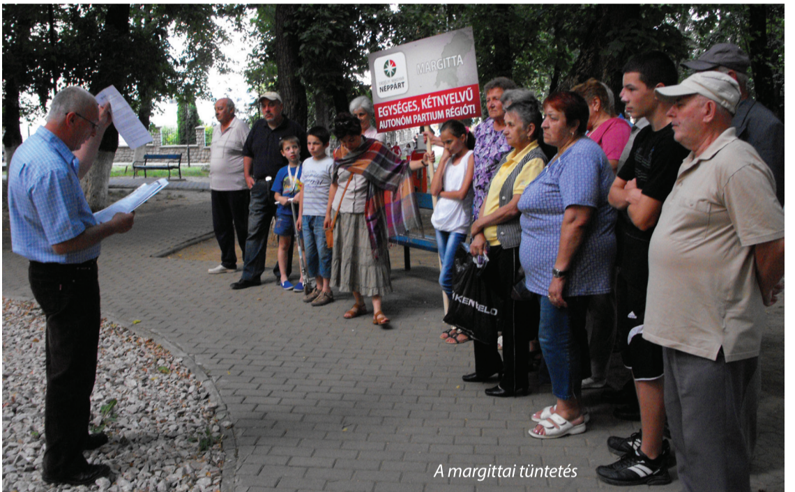
A margittai tüntetés