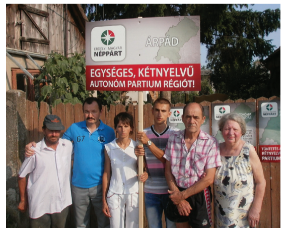
Árpádon maroknyian voltak