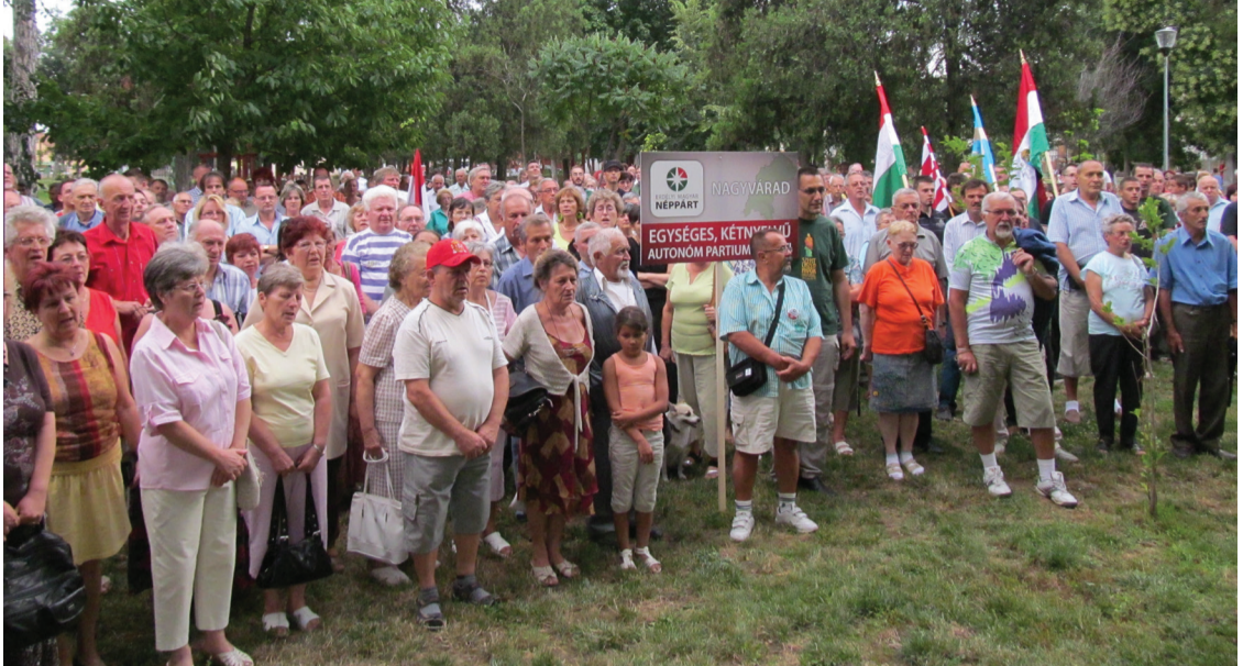
Közel ezres tömeg a nagyváradai Olaszi parkban

Az Erdélyi Magyar Néppárt – az Erdélyi Magyar Nemzeti Tanács támogatásával – 2013. július 20-án 20 órakor húszperces tüntetéseket szervezett Románia közigazgatási átalakítási terve elleni tiltakozásként az ország 119 településén. Ezek között ötven partiumi és 24 Bihar megyei helyszín volt, csupán pár településen nem sikerült időben megszervezni a tervezett akciókat. Megyénként Nagyváradon, Érmihályfalván, Nagyszalontán, Margittán, Székelyhídon, Árpádon, Bályokon, Bélfenyéren, Biharon, Bihardiószezen, Érkörtvélyesen, Érselénden, Érsemjénben, Éroasziban, Hegyközpályiban, Hegyközsárdobágyon, Hegyközszentmiklóson, Hegyközújlakon, Szalacson, Ottományban, Örvénden, Paptamásiban és Tenkén demonstráltak és gyűjtöttek aláírásokat az ügy iránt elkötelezettek azért, hogy a Partium egységes, kétnyelvű autonóm közigazgatási régió legyen, az illető település ehhez tartozzon, és ezt helyi népszavazás szentesítse.