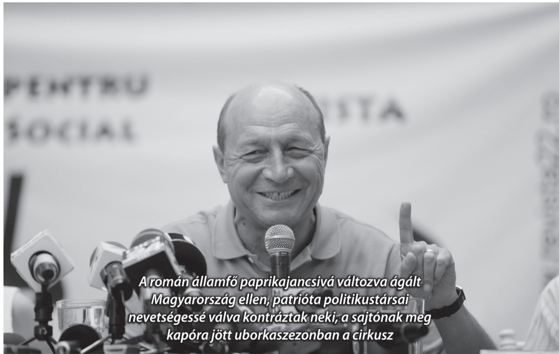
A román államfő paprikajancsivá változva ágált Magyarországot ellen, patrióta politikustársai neveltségessé válva kontráztak neki, a sajtónak megkapóra jött uborkaszegzonban a cirkusz