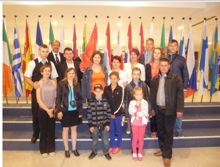
Az érmelléki küldöttség

A kiállítás huszonkét gazdagon illusztrált mozgóplakáton mutatja be azokat a hagyományos történelmi tájegységeinket, valamint jellegzetes településeinket, melyek alapján egy szülőhazánkkal ismerkedő idegen hiteles képet alkothat magának Erdélyről, ezen belül az erdélyi magyar kultúránk és hagyományaink gazdagságá-