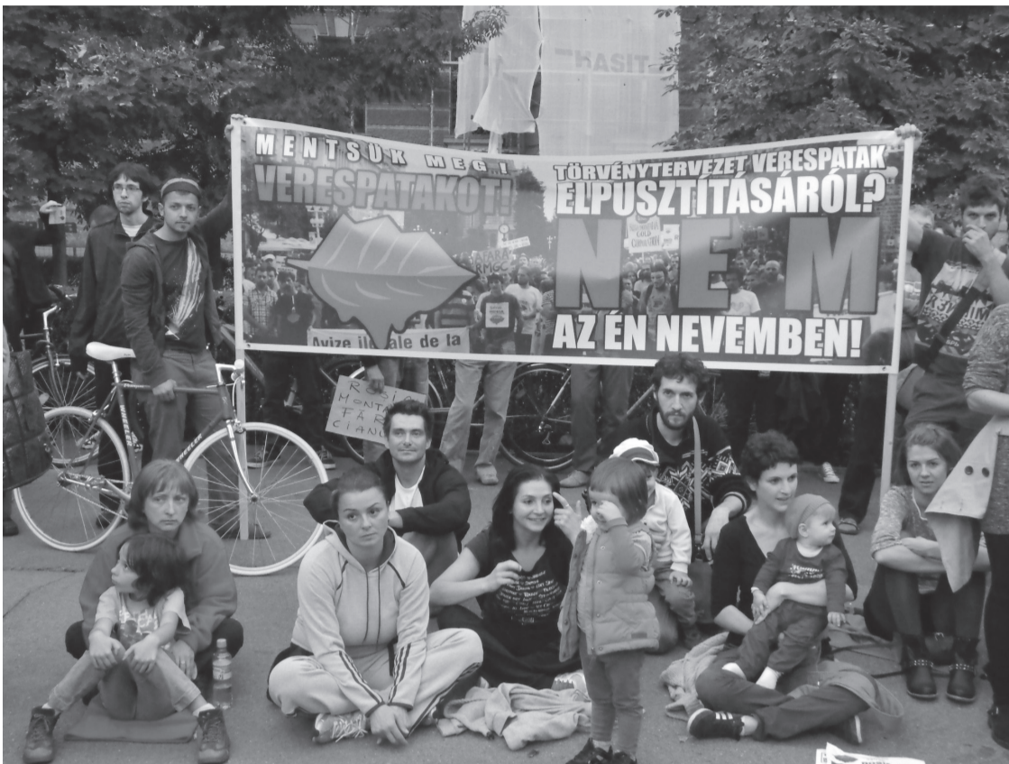
Románia szinte minden nagyobb városában hetek óta zajlanak a kisebb-nagyobb tömegtüntetések a tervezett verespataki bányanyitás, valamint a regnáló kormányzat ellen. Az egész korrupciós politikai osztály távozását és felelősségre vonását szorgalmazó demonstrálókat a különféle civil szervezetek hívják a terekre, miközben a politikai szervezetek többsége lapít. Bihar megyében egyedül az Erdélyi Magyar Néppárt segíti és támogatja az öntudatos kiállást, a szervezet vezetői és tagjai magánemberekként is rendszeresen élnek az állampolgári véleménynyilvánítás és tiltakozás jogával e közösségi alkalmakon

– Ez szemenszedett hazugság, manipulatív propaganda, amit arra alapoznak, hogy az idegen érdekeltségű RMGC vállalat munkahelyeket ígér és biztonságos technológiát. Ami a munkahelyeket illeti, több mehet tönkre, mint amennyi létrejön. A kiaknázás során olyan ciántartalmú zagyatározó alakul ki, melynek mérete a Velencei-tóéhoz hasonló. Háromszáz hektáron lep majd el mindent a ciános víz. Kipárolgása esőként hull vissza a környezetre. A környéken több száz gazda és családja él szarvasmarhatartásból. Ki fog vásárolni ezektől a gazdáktól olyan tejet vagy húst, amelyik egy ciántartalmú tó környékén legelő állattól származik? Ki fog turistaként a családjával, a környékre látogatni tudván, hogy egy mérgeztelep van a környéken? Az aranybánya körülbelül másfél évtizedik üzemelne, adna munkát, míg a hatása több évtizedekre lehetetlenítheti el a környékbeliek megélhetését. Ami a biztonságos technológiát illeti, abszolút biztonság nincs. Soha nem lehet tudni, a természet milyen erővel támad, illetve mit bír ki a zagyatározó gátja. Ha ez az emberi építmény valamilyen előre nem látható okból átszakadna, ez rettenetes pusztítást okozna. El sem tudjuk képzelni, milyen hatása lenne az itt élő emberekre, de még a távolabbi környezetre is, hosszú évtizedeken keresztül. Mindezt úgy vállalja az itt élő közösség, hogy a haszon tetemes része kimegy az országból. Ezen tükrében úgy gondoljuk, ilyen körülmények között nem szabad ennek a projektnek zöld